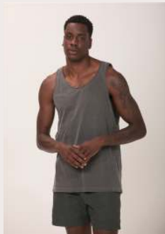
REGATA RELAX REF 1023