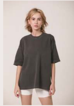
URBAN ●●○ REF 1026