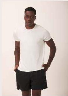
MODAL REF 1032