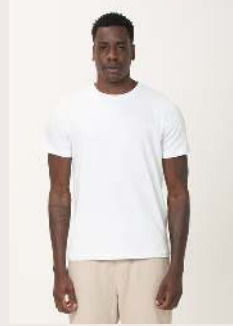
ALGODÃO EGÍPCIO GOLA COMUM REF 1084