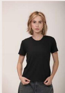
MODAL ●●○ REF 1035