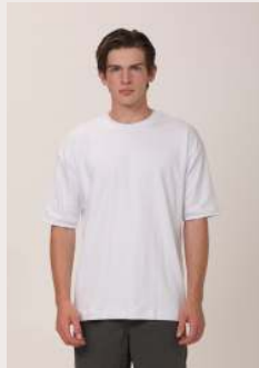
OVER 1.0 REF 1026