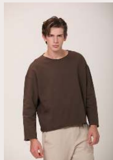
CASACO BOX DESFIADO REF 1061