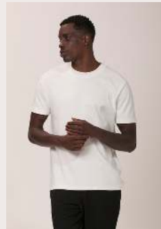
BOSSA REF 1052