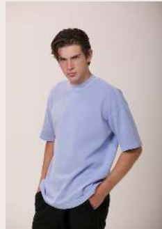
QUADRILLE REF 1045