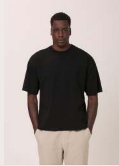
URBAN REF 1026