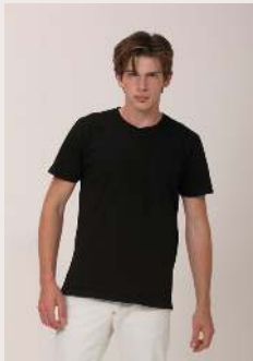
CLASSIC REF 1024