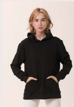
MOLETOM CAPUZ ●○ REF 1086