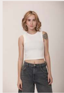
REGATA CROPPED ●●○ REF 1073