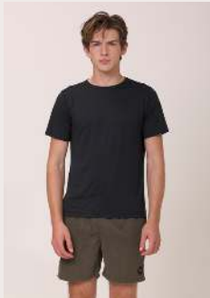
POLIAMIDA REF 1084