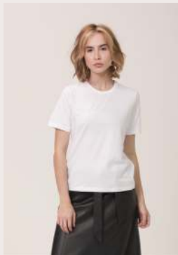
ALGODÃO EGÍPCIO ●○ REF 1083