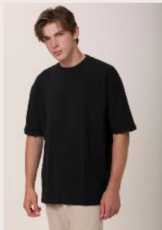
TRICÔ REF 1037