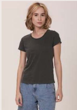
BABY LOOK ●●○ REF 1025