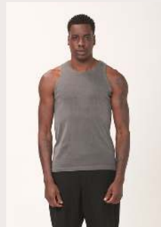
REGATA RIBANA REF 1076