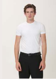
ALGODÃO EGÍPCIO GOLA COBERTURA REF 8902567