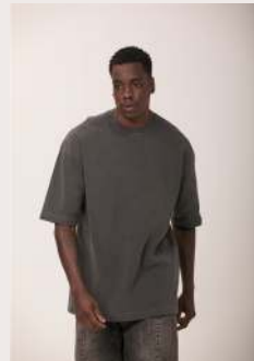
OVER 3.0 REF 1043