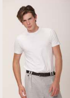
ALGODÃO PIMA REF 1084