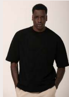
ALESKA REF 1045