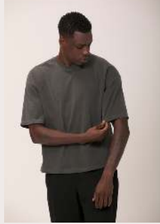
BOX REF 1026