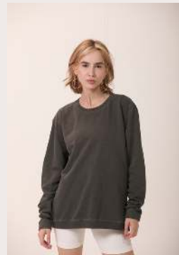
BLUSÃO ●●○ REF 1086