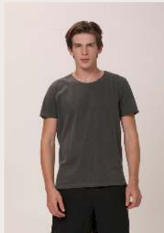
RELAX REF 1030