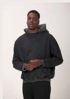
MOLETOM BOX ESTONADO REF 1061