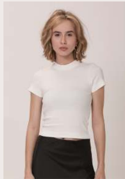
BABY TEE ●●●●○ REF 1081