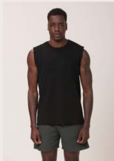
REGATA MACHÃO REF 1062