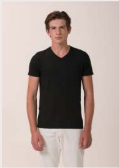
MODAL GOLA V REF 1032