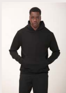
MOLETOM CAPUZ REF 1086