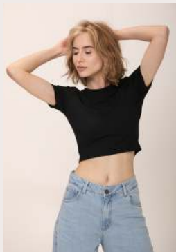
CROPPED MODAL ●●○ REF 1064