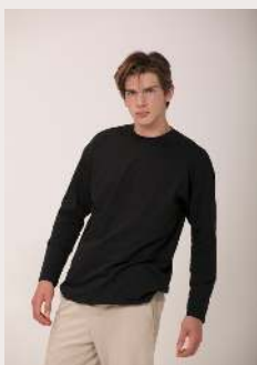
MANGA LONGA REF 1087