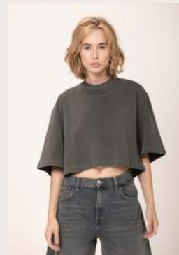
CROPPED OVER ●●○ REF 1082