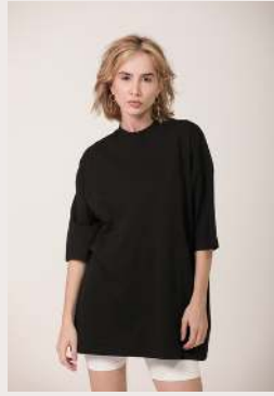
OVER 3.0 ●●○ REF 1043