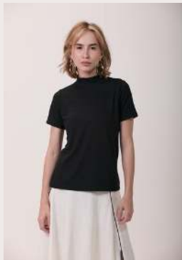
MODAL GOLA ALTA ●●○ REF 1035