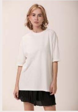
OVER 1.0 ●●●●○ REF 1028