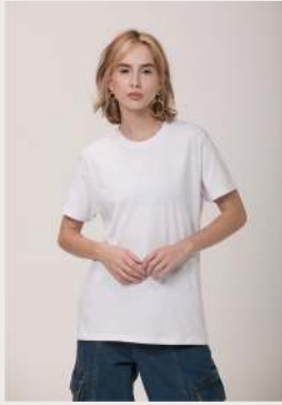
CLASSIC ●●●●○ REF 1024