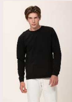
BLUSÃO REF 1086