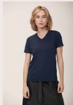
MODAL GOLA V ●●○ REF 1035