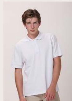
POLO REF 1036